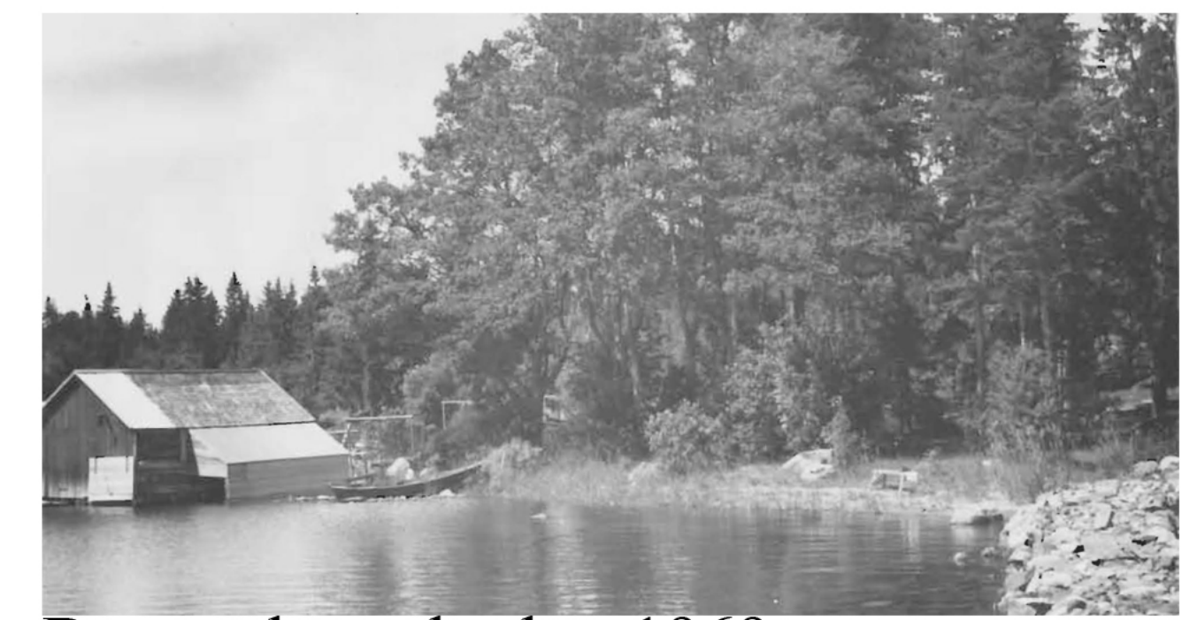
Brygga byggdes här 1969