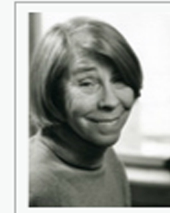
TOVE MARIKA JANSSEN 9.8.1914 – 27.6.2001 Finlandssvensk författare, bildkonstnär, skämttecknare och serietecknare. Skapade de älskade muminböckerna, gjorde en mångsidig karriär både som författare och som bildkonstnär.