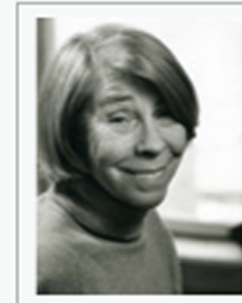
TOVE MARIKA JANSSON 9.8.1914 – 27.6.2001 Finlandssvensk författare, bildkonstnär, skämttecknare och serietecknare. Skapade de älskade muminböckerna, gjorde en mångsidig karriär både som författare och som bildkonstnär.