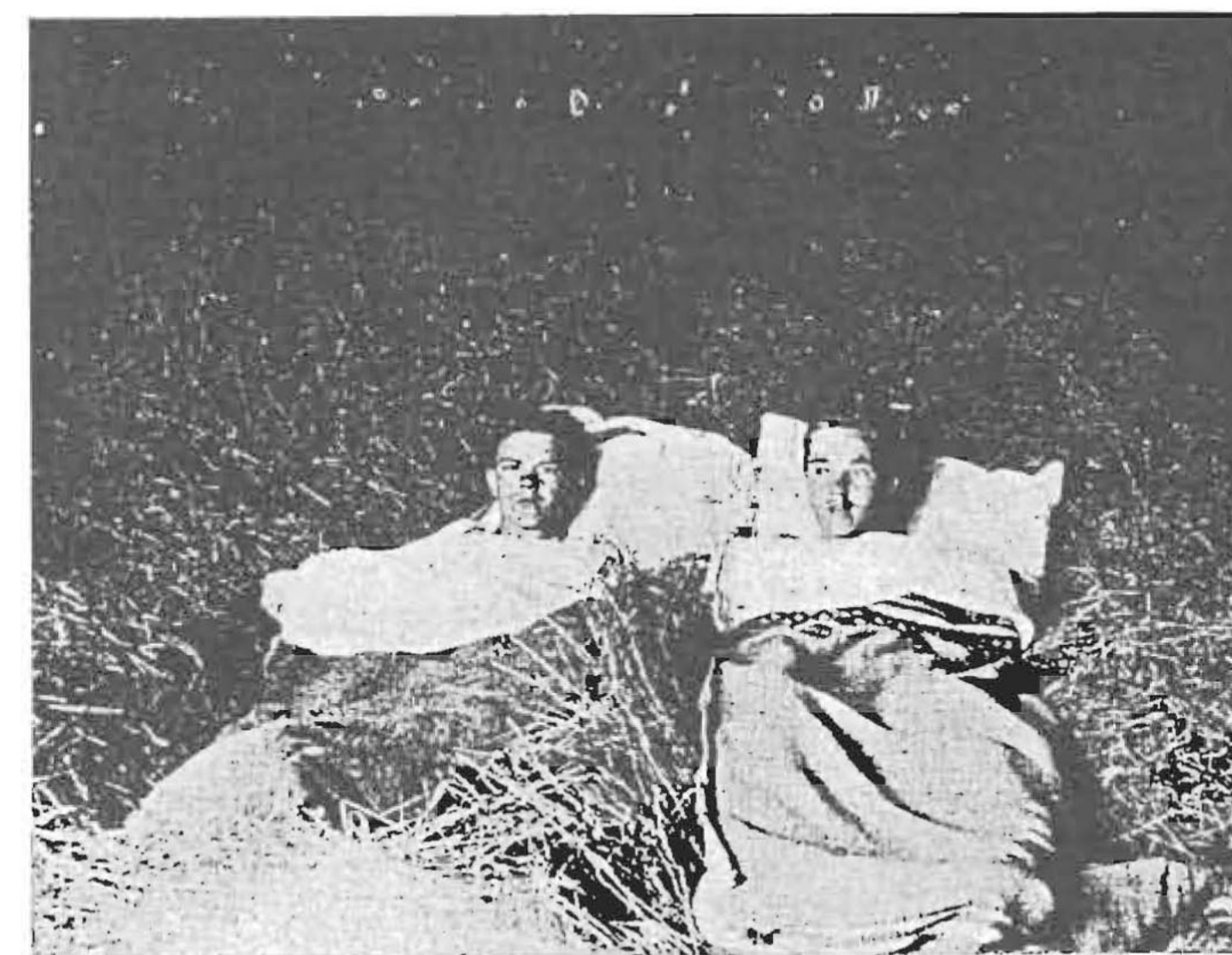
I hotell »Långa ladan».