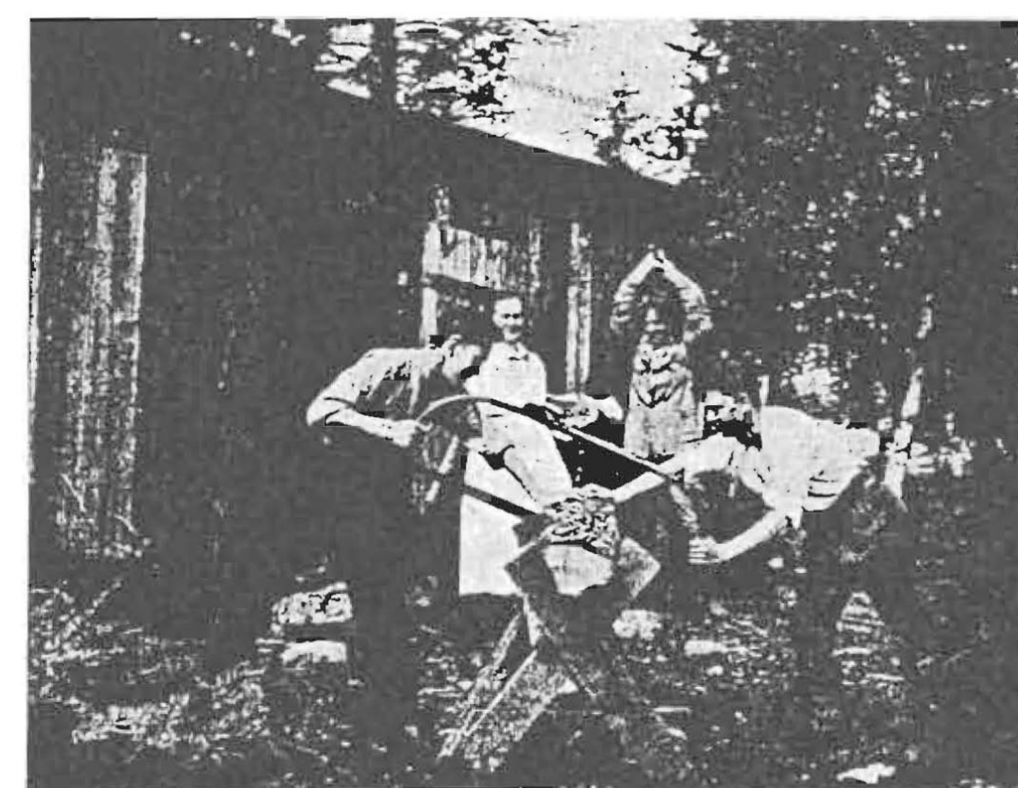
Kökspatrullen och malmor.

För varje dag har husmor att kommendera över en »kökspatrull» på tre man. Den skall vara redo kl. 4 på morgonen, när skötbåtarna komma i land efter nattens fångst, för att inköpa erforderliga hektomber färskströmming för en ringa penning. Strömming är gott och kan anrättas på 99 sätt. Kökspatrullen skall hugga ved och hålla eld i spisen, diska, torka och passa upp vid bordet. Och bordet skall digna av mat. »Ät, drick och var glad. Varen alltid gladel» — det är valspråket på Singö. Och inte är det tråkigt att vara kökspatrull.