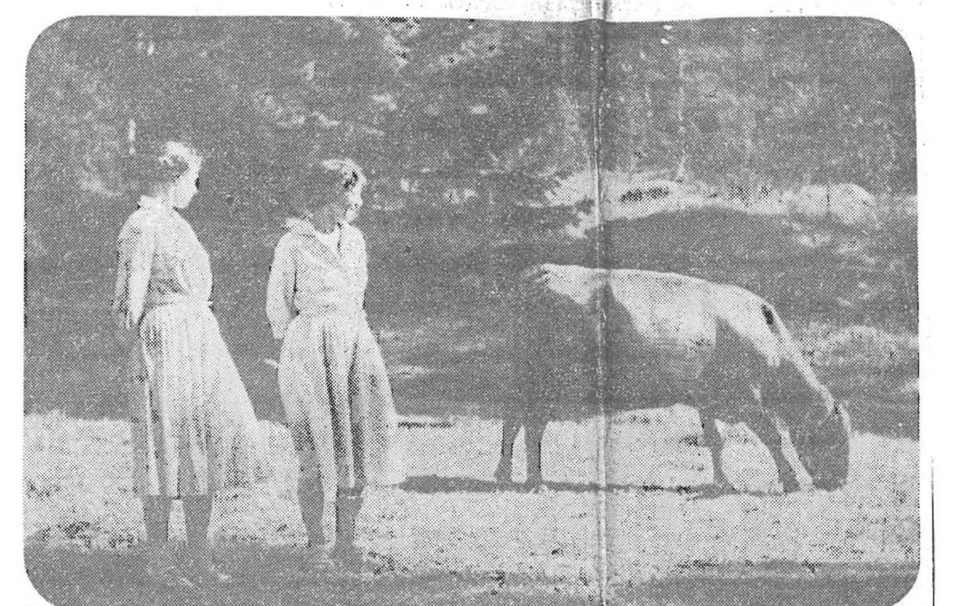
Hildas ko, som ger filbunken med gult rynkigt skinn på den farliga skogen i bakgrunden.