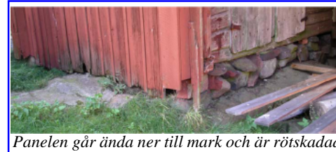
Panelen går ända ner till mark och är rötskadad

Mattsgården: På Mattsgården genomfördes 7 annonserade visningar och några extra på beställning. Antal besökare och nettointäkter blev som tidigare år. Stockholms läns museum har efter beställning från föreningen gjort en genomgång och identifierat behovet av akuta underhållsåtgärder på ekonomibyggnaderna. Länsmuseets rapport finns utlagd i Mattsgården och på hemsidan. Kontakt har tagits med lokala snickare för att renoveringsarbetena på ladugården ska kunna starta 2008.